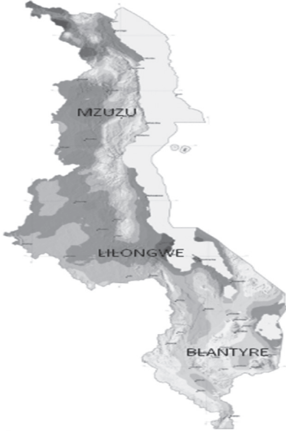
Şekil 2: Malawi'deki Fotovoltaik Enerji Potansiyeli